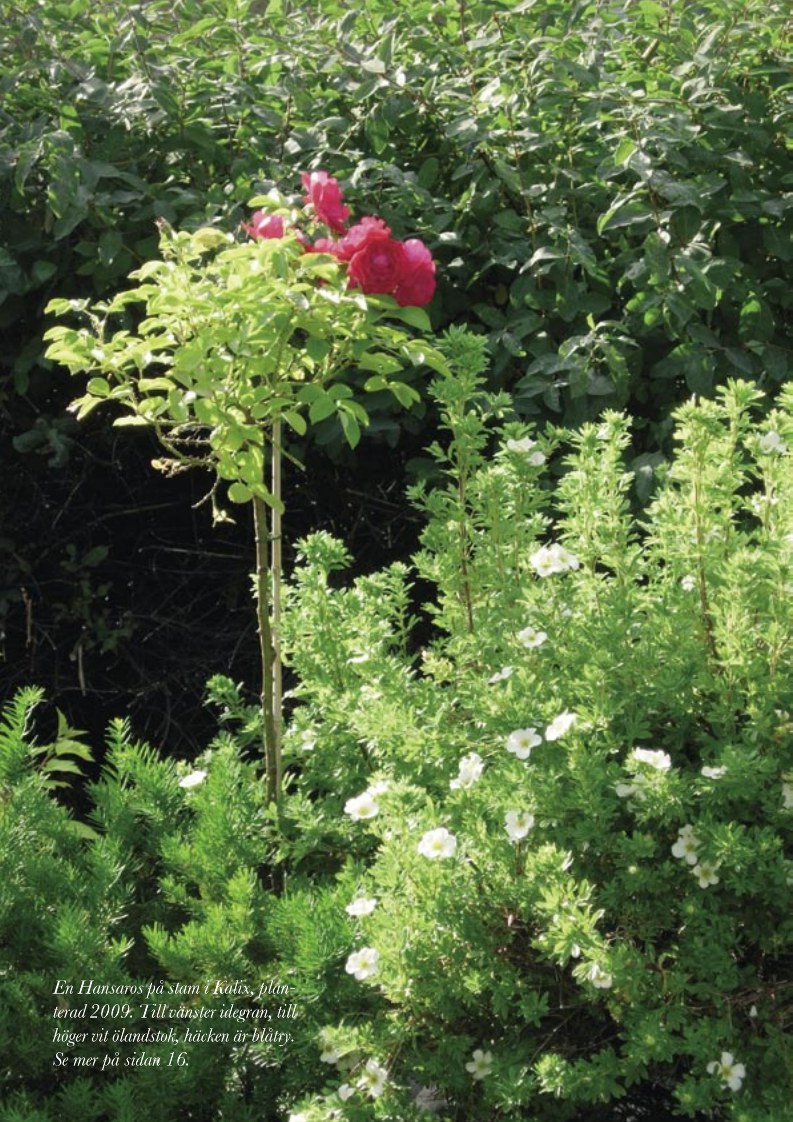
En Hansaros på stam i Kalix, planterad 2009. Till vänster idegran, till höger vit ölandstok, häcken är blåtry. Se mer på sidan 16.